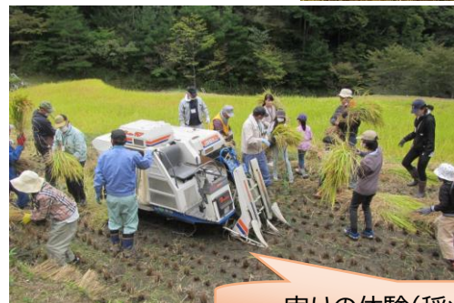
実りの体験(稲刈りの様子)