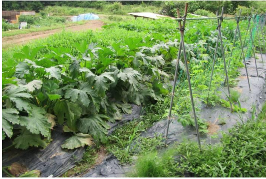
7月上旬のやさいの会の畑の様子