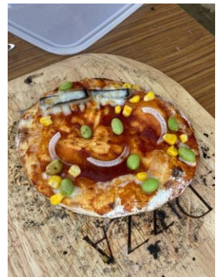
顔のピザ (お友達かな?)