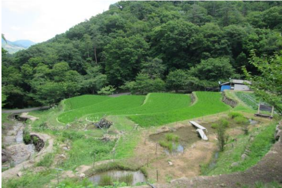
青々とした棚田の様子

人数制限の中、4月には里山あーと村を紹介する「里山参観日」を開催したところ、3日間で57名の方に、また5月の「田植えと里山自然体験」では37名の方に御参加いただきました。参加者からは「初めて来たけど、こんな所があるのは知らなかった」「自然がいっぱいで気持ちいいね」という声を聞きました。コロナ禍のため、食事の提供はまだまだ自粛モードですが、一日でも早くここ里山あーと村や安芸区阿戸町でとれた食材で作った食事を提供し、この自然の中でのんびりと楽しめる日が来ることを、心待ちにしています♪