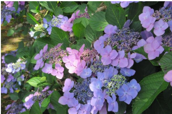
紫陽花もにぎわっています。

人数制限の中、4月には里山あーと村を紹介する「里山参観日」を開催したところ、3日間で57名の方に、また5月の「田植えと里山自然体験」では37名の方に御参加いただきました。参加者からは「初めて来たけど、こんな所があるのは知らなかった」「自然がいっぱいで気持ちいいね」という声を聞きました。コロナ禍のため、食事の提供はまだまだ自粛モードですが、一日でも早くここ里山あーと村や安芸区阿戸町でとれた食材で作った食事を提供し、この自然の中でのんびりと楽しめる日が来ることを、心待ちにしています♪