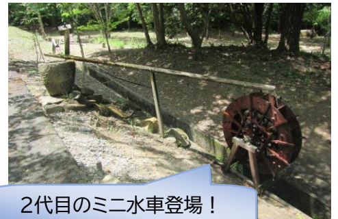
2代目のミニ水車登場！

この夏は、基本的なコロナ感染症対策を取りながら、小まめな水分補給などの熱中症対策にも気を配り、無理のない範囲で各部活動に参加していただきますよう、お願いします。