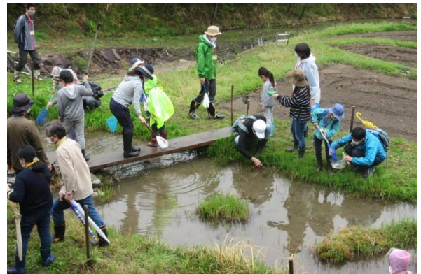
里山参観日の様子