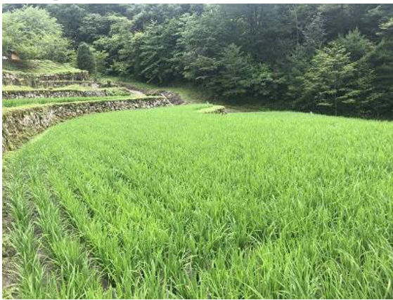
↑ 7月上旬の棚田の様子