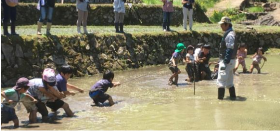
(写真) どろんこ綱引き

昨年とうってかわって暑い日差しのなか、サツマイモの植え付けや田植え、どろんこ綱引き、里山の特製お風呂での「どろ落とし」とめいっぱい里山を楽しみました。お昼の里山特製「ぼたもち」は、あんこがいっぱいで満腹に、また暖かい豚汁が最高でした。