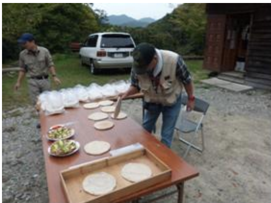
↑10月10日に準備として、220枚のピザ生地を焼きました。