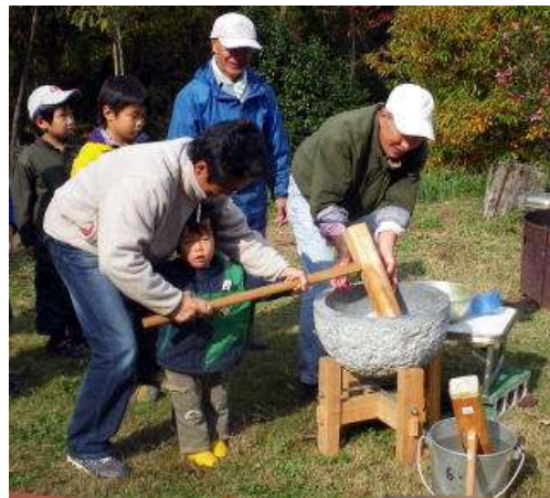
ぺったんこ、ぺったんこ、もちつき