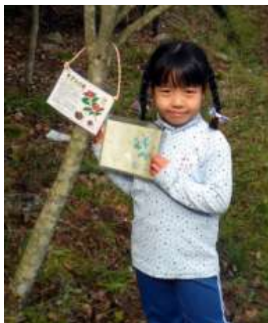
新しいラベルになりました！