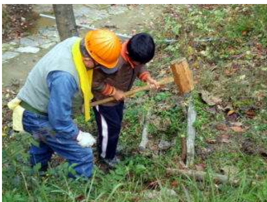
大きなかけやを持って…がんばれ!がんばれ!