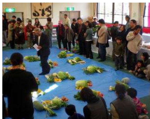
今年も新鮮な野菜がいっぱいでしたこの一山、まとめていくら?