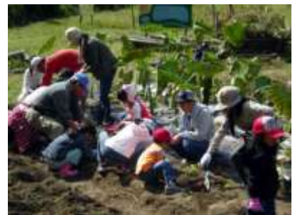
大きなおいも…でてこ～い！

14 時から「毎日正月」の皆様とパーカッションの演奏を楽しみました。秋色の哀愁を帯びた二胡の音色、太鼓の陽気な音に子ども達も興味深々。初めての生演奏、コンサートだった子どもさんもいらっしまったのかもしれないですね。楽しい一日になりました。