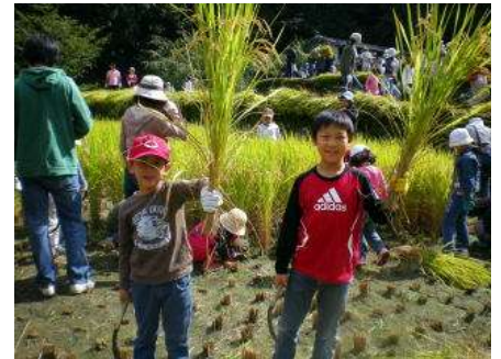
笑顔の素敵ハンサムBOYS

今年も総勢 213 名の参加者で、3班に分かれてあーと村の棚田を3枚とも手刈りで稲刈りを行いました。広～い田もたくさんの参加者の皆様のおかげでアレヨアレヨという間に刈り取りが終わり、2台の脱穀機で脱穀し、切りわらを撒きました。(脱穀を初めて見る方も多かったのでは!?)