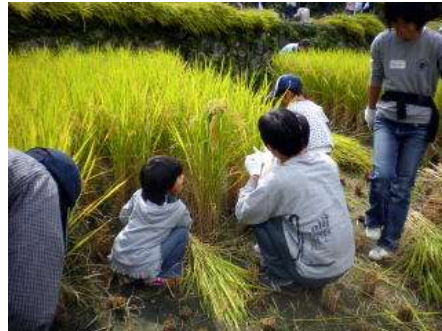
みんなでやると早いねえ～(^_^)v