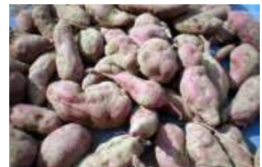
今年は豊作！さつまいも♡