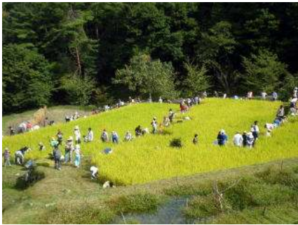
さあ稲刈り…がんばるぞ！