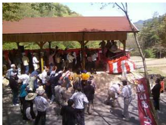
皆さ〜ん、お餅はちゃんととれましたか？