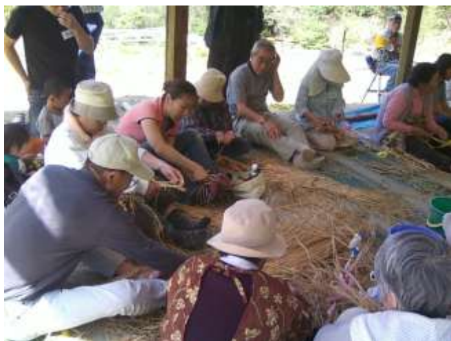
みんなで挑戦 わら細工