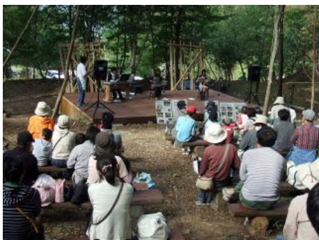
←ぶちコンサート風景 「ポ～ニョ♪ポ～ニョポニョ…」

当日は、阿戸町産こしひかりと黒米の新米を販売しましたが、あっという間に完売してしまいました。11月の収穫祭の時にも販売しますので、皆様、ぜひ買って帰って下さいね。