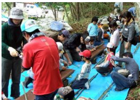
←竹笛づくり ピーピー♪

竹の楽器作りは、主に竹笛をつくりました。直径2cm弱くらいの竹に穴を開けて、吹き口になる小さな竹を組み合わせて笛が上手く鳴る位置を探すのですが、ポンドでくっつける時にズレてしまったり…いろんな苦労があったようです。あちらこちらから「ピーピー」というかわいい音が聞こえていました。