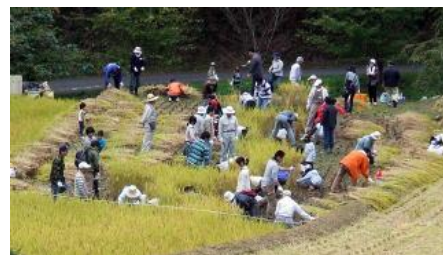
稲刈り がんばってます