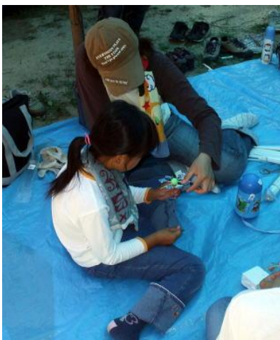
かざぐるまづくり はねを作っています