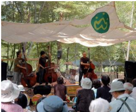
3本のベースによる演奏