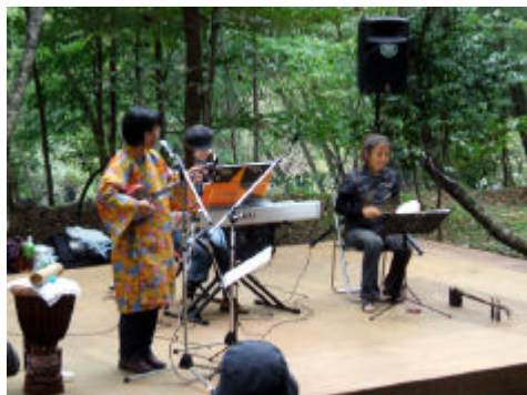
森のぷちコンサート