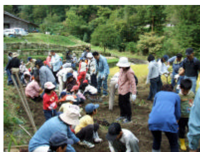
お芋がたくさんとれるかな？

また当日は阿戸町産棚田米と黒米(古代米)の販売もしました。あっという間に準備していたものが完売しました。次回の収穫祭でも販売しますので、ご希望の方はお忘れないように！