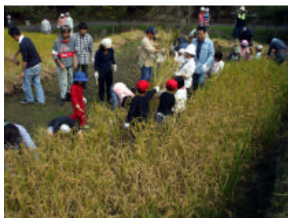
稲刈りも大人数なら早いね