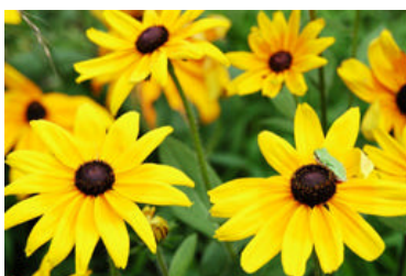
ひまわりとカエル(7月)