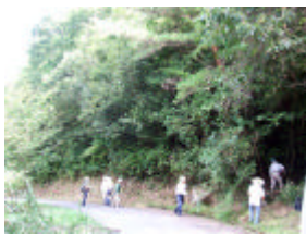
棚田東側の手入れ前

集 合 山小屋前集合 持ち物 汚れても良い服装、靴、手ぬぐい、帽子、 軍手、弁当（軽めで）飲み物