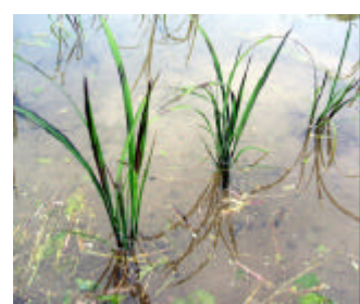
苗の時から、少し黒め？