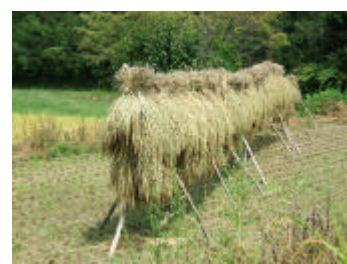
9月8日 稲刈&はぜかけ