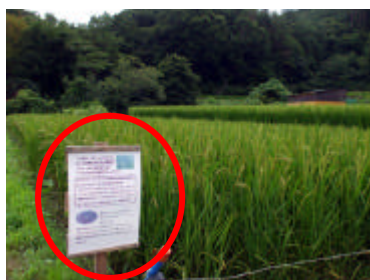
この看板がある所です

この苦労一杯・ミネラルたっぷりの黒米は、今後里山あーと村のイベント等で販売していきます。是非一度ご賞味あれ！