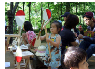
風見鶏 (もぐらおどし)

また6月の森の日では、植樹をして丸太切り競争をして、炭焼き釜でピザを焼き、やさいの会の「採れたてお野菜スープ」を頂き、折りたたみ椅子・風見鶏(もぐらおどし)・写真立てなどを作って帰る...という と~っても盛りだくさんのメニューでした。参加者は時間を忘れて夢中になっていましたよ。