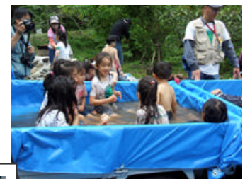
5/20 軽トラ温水プール